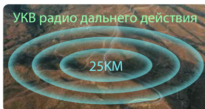
УКВ радио дальнего действия

1,39 дюймовый сенсорный MAX 5 обеспечивает прямой доступ ко всем функциям в режиме реального времени без контроллера. Интуитивно понятный интерфейс сокращает время настройки и сводит к минимуму ошибки, обеспечивая точную и эффективную работу в полевых условиях.