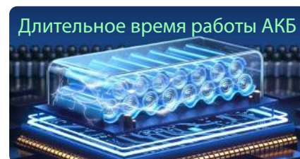
Длительное время работы АКБ

Встроенный радиомодуль MAX 5 мощностью 5 Вт + LoRa дает надежное покрытие RTK до 25 км. Он гарантирует стабильную связь между базой и ровером в сложных условиях, заменяя внешние радиомодули для ускорения настройки и обеспечения стабильной сантиметровой точности.