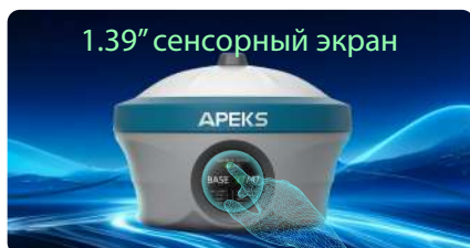
1.39" сенсорный экран

1,39 дюймовый сенсорный MAX 5 обеспечивает прямой доступ ко всем функциям в режиме реального времени без контроллера. Интуитивно понятный интерфейс сокращает время настройки и сводит к минимуму ошибки, обеспечивая точную и эффективную работу в полевых условиях.