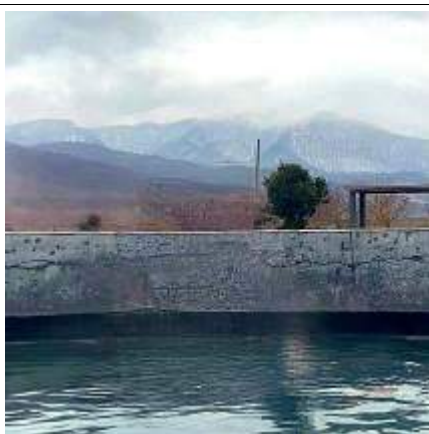
Термальный источник Бирагзанг

Каждый день на протяжении новогодних праздников на Мамисоне будут мероприятия, подробнее в день отправления у сопровождающей!