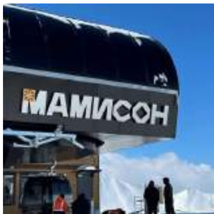
Горный курорт Мамисон

Вас ждет новый горный курорт Северной Осетии-Алании - Мамисон , где мы поднимемся на закрытом фуникулере на высоту 2 950м. Перед нами откроется величественная панорама на Великий Кавказский хребет. В самом сердце курорта на центральной площади Калак, археологи обнаружили Святылище христианской церкви , датируемое 7-9 веками, а недалеко от курорта находится музей под открытым небом Лисри , где 14 родовых 15-метровых башен и дома горцев создают сеть узких улочек, из-за чего Лисри ещё называют городом-лабиринтом.