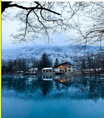
Голубое Нижнее озеро

Обед (за доп.плату, по желанию) с видом на Голубое Нижнее озеро - одному из самых красивых природных объектов региона. Насладитесь природной красотой, сделайте памятные фотографии и отдохните на свежем воздухе.