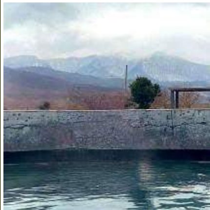
Термальный источник Бирагзанг

В окончании экскурсионного дня - с.Верхний Бирагзанг, горячий источник : бассейн в горах под открытым небом. Вы искупаетесь в лечебной воде и отдохнете после насыщенного дня.