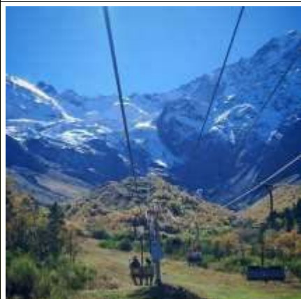
Горный курорт Цей

После завтрака вы отправитесь в самое загадочное ущелье Северной Осетии-Алании — Цейское . Вы будете путешествовать по живописной горной Транскавказской магистрали (историческое название Военно-Осетинская дорога), которая пролегает через Главный Кавказский хребет. Любуясь завораживающими красотами, вы увидите уникальный монумент «Ныхас Уастырджи» , который в народе называют Святой Георгий Победоносец возвышается над скалами. Далее въезд в Цейское ущелье, сопровождающий расскажет много интересных легенд и преданий, которыми окутаны эти места. Обед (доп.плата) по приезду на Цей.